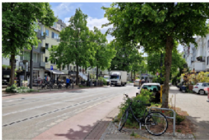
Steffen Breyer, VCD, 2025

Kausale Zusammenhänge zwischen Verkehrsberuhigungsmaßnahmen und einer wirtschaftlichen Schlechterstellung des stationären Einzelhandels sind vor dem Hintergrund der vorliegenden Untersuchungen nicht belegbar.