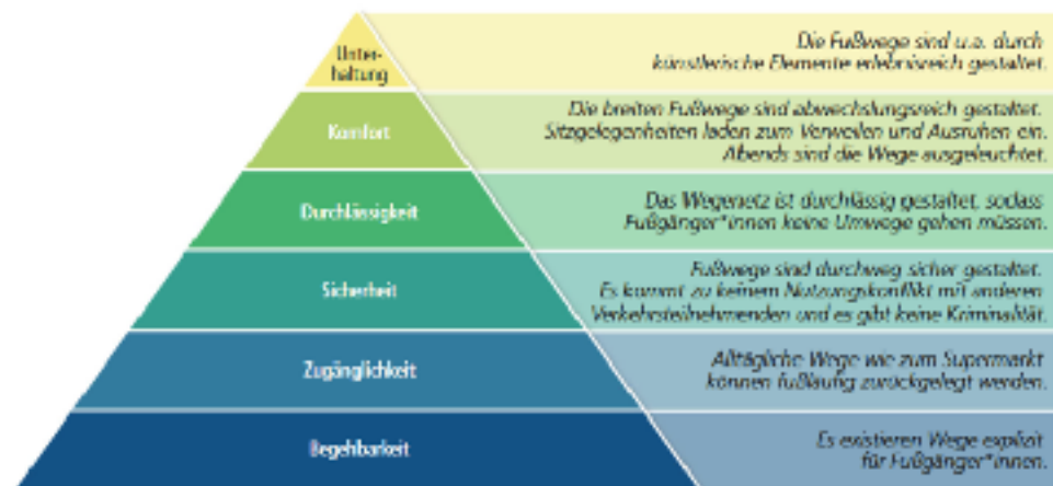
Abbildung 1 Bedürfnispyramide der Walkability

Grafik: Jutta Rönsch