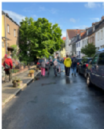
Exkurs: Klimazone Findorff Jane's Walk 10.6. (17 - 18:30 Uhr)

Außerdem gab es begleitende Aktionen wie den Jane's Walk ins Findorff, Bürgersprechstunden, Checklisten-Unterstützung (fortlaufend März bis Oktober), den Parking Day etc.